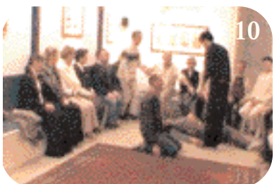
10 I.L. fait allonger d'autres représentants des victimes.