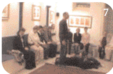
7 Il s'allonge comme un mort à côté du père.