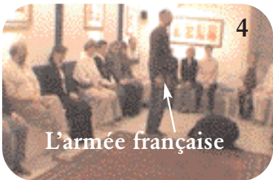
4 I.L. demande à un autre homme de se tenir debout devant le père soumis.