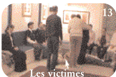
13 I.L. fait se relever les vivants.