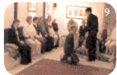
9 L'Algérien se détourne en répondant à I.L. "Je ne lui pardonne pas".