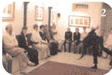
2 Ce représentant se montre physiquement très tourmenté.