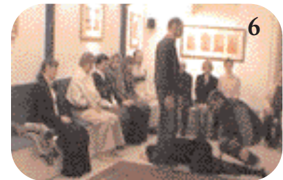
6 Très vite, celui-ci tombe à genoux.