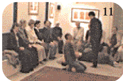
11 L'Algérien lui tend la main...