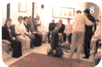
8 I.L. relève le père et lui demande de regarder.