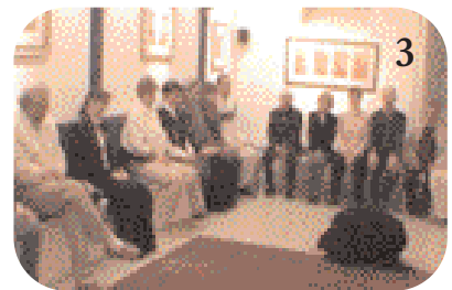
3 Il s'écroule très vite, en position de soumission