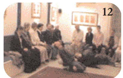
12 Le représentant de l'armée française s'est affaissé, puis allongé.