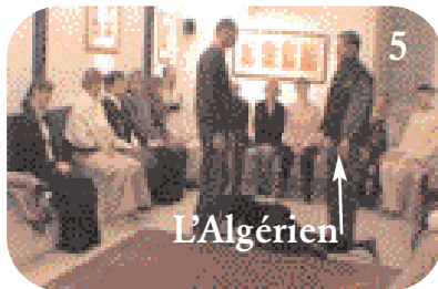
5 I.L. met en place un 3 e homme, cette fois derrière le représentant du père.