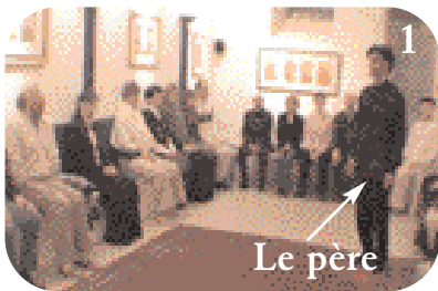
1 Le client choisit un représentant pour son père.